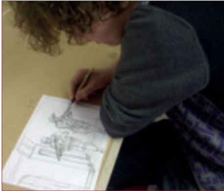
Personages uit games vormen een geliefd onderwerp. Ze worden zonder enig voorbeeld op papier gezet.